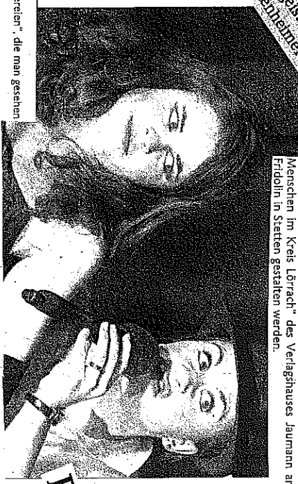
Satirische Wertarbeit vom Feinsten